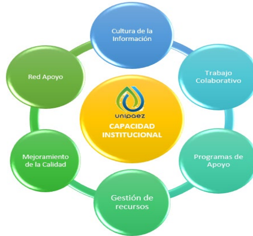
Figura 1 Esquema de los ejes del Sistema de Gestión de Permanencia y Graduación Estudiantil UNIPAEZ