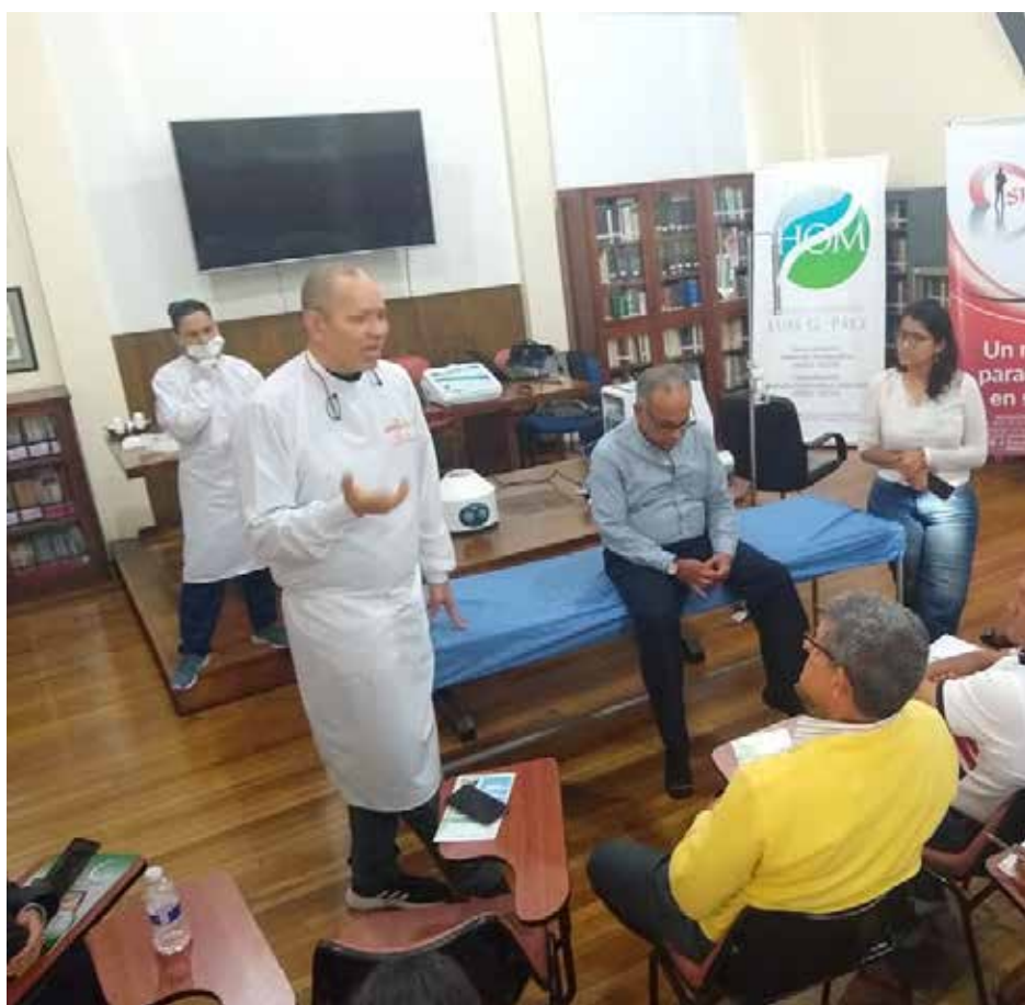
Curso Ozonoterapia y Aceites Esenciales.