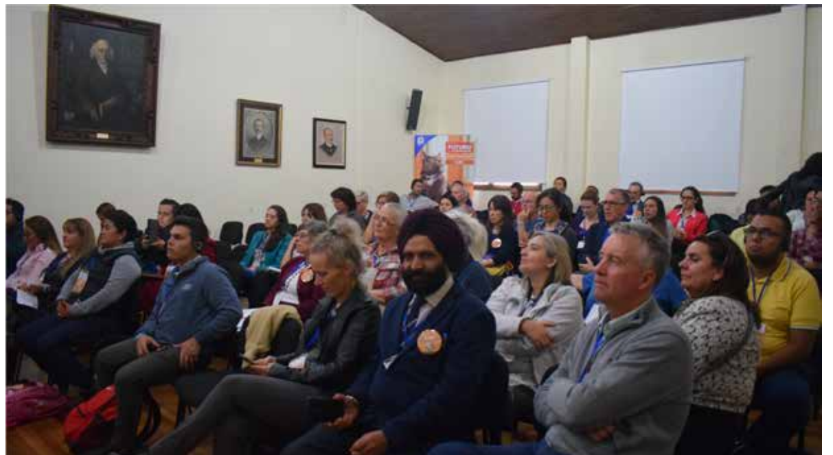
Congreso Mundial Homeopatía Veterinaria IAVH Colombia 2019.

Para la UNILUISGPAEZ este número de la publicación de Academia Homeopática se constituye en un importante logro de este 2020. El 2019 determinó cambios importantes para la Institución y que tuvo el desarrollo de significativos acontecimientos, entre los que se destacan el fortalecimiento de la gestión institucional, la capacitación, bienestar docente y estudiantil, fortalecimiento de la virtualidad y especialmente la participación de un importante número de estudiantes de fuera de Bogotá e internacionales provenientes de nuestro hermano país, Ecuador.