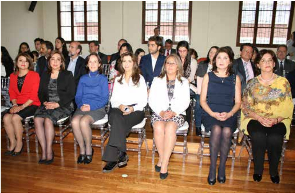
Séptima promoción - grados febrero 22 de 2019