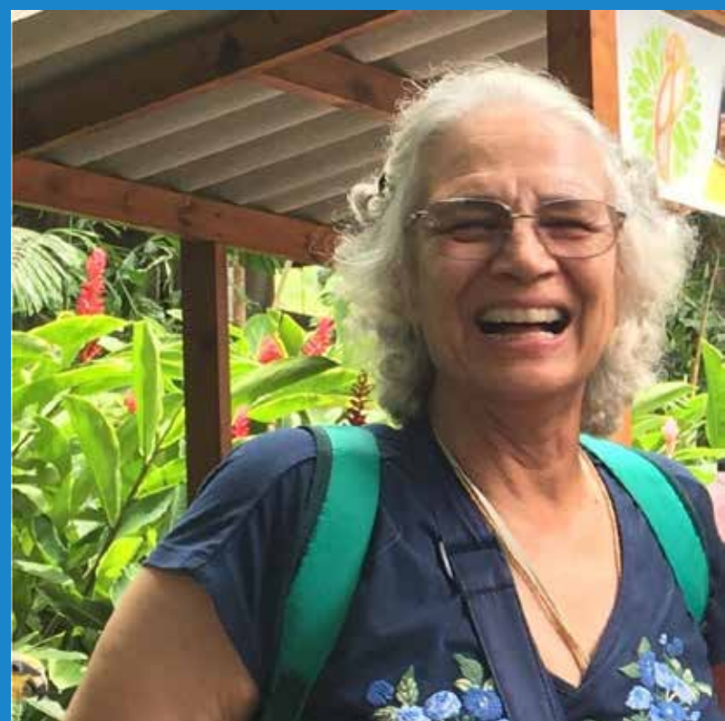
Cartagena Colombia junio 2019