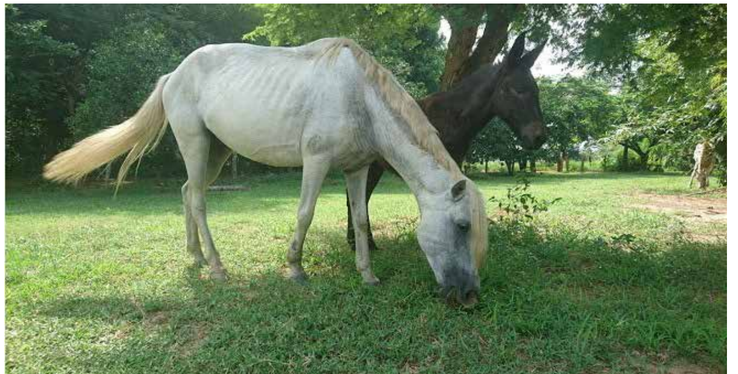
Fotos No. 3 y 4. Lesión en el lado opuesto de la nariz y labio superior de Pirata el 8 de febrero de 2011.

Son observaciones relevantes y conexas con la investigación, que ninguno de los dos animales volvió a contraer garrapatas después de los tratamientos homeopáticos. También que tras comenzar los tratamientos homeopáticos, mejoró radicalmente el temperamento de los animales, en especial el de la yegua; esto se debe a que el medicamento actúa sobre el miasma sifilítico (crónico), modificando el orden implícito del individuo, potencializando su fuerza vital y permitiéndole estar más tranquilo, aceptar la cercanía y buscar el contacto con la veterinaria. Al final del tratamiento, incluso se les podía suministrar el medicamento sin necesidad de enlazarlos.