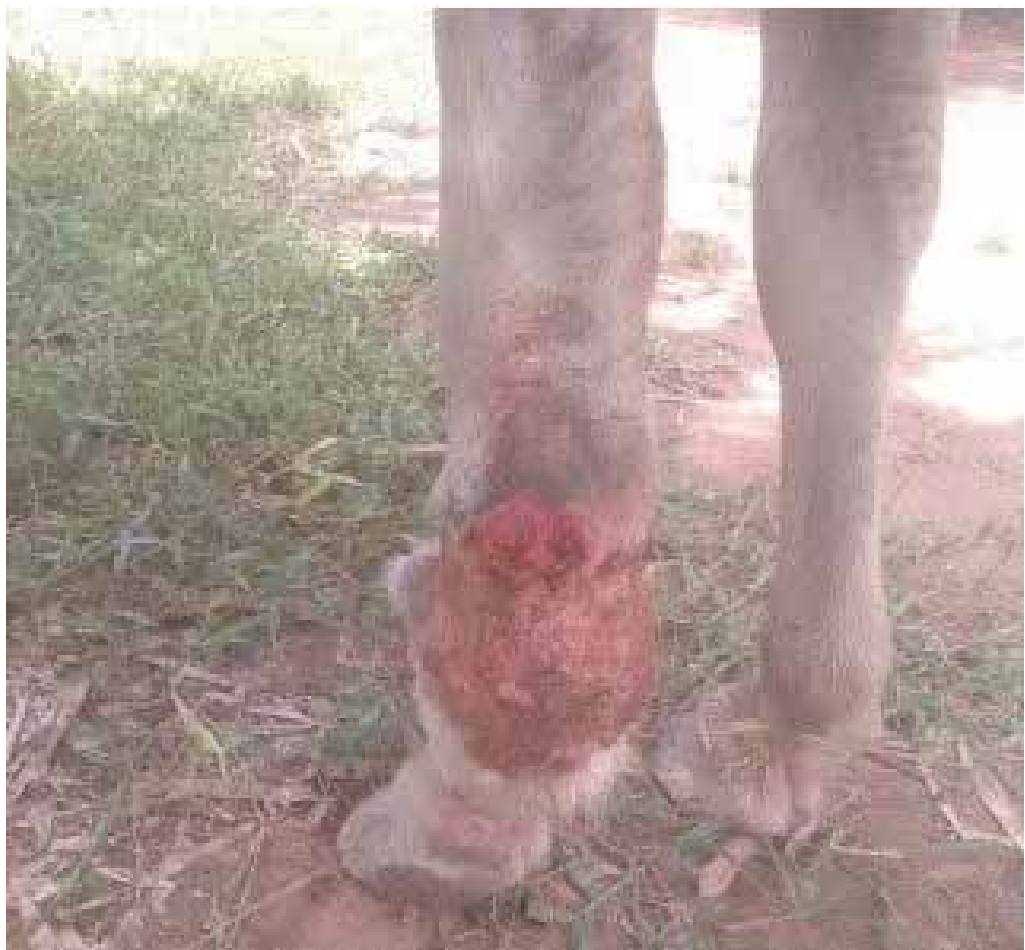
Foto No. 15. Lesión de Pirata un poco mejor en septiembre de 2016.

Entonces Pirata fue repertorizado nuevamente (ver cuadro No. 4) y se comenzó un tratamiento con 1 gota de Nitric Acid 200® diluida en 10 cc de agua, con 10 golpecitos previos, todos los días en la mañana desde junio hasta diciembre del 2016. En julio la lesión se veía como en las fotos No. 12, 13 y 14; en septiembre se veía como en la foto No. 15, en octubre y noviembre estaba como se ve respectivamente en las fotos No. 16 a 21, la herida presentaba un aspecto sanguinolento y pruriginoso, pero estaba comparativamente mejor que en otros momentos, sin embargo el caballo lucía triste y el ganglio pectoral izquierdo seguía inflamado.