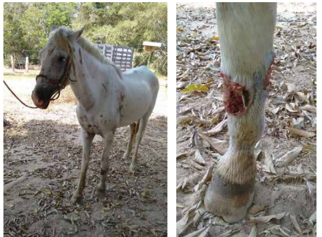
Fotos No. 8 y 9. Lesión con mejoría, del 21 de febrero de 2016.

Tras este tratamiento el paciente comenzó a presentar mejorías y recaídas intermitentes. Entre enero del 2016 y enero del 2017 el caballo bajó de peso notablemente, mantuvo el ganglio del pectoral izquierdo siempre inflamado, manifestó alopecia generalizada, secreción de moco y emanación de un olor nauseabundo proveniente de la lesión. Ésta no presentó miasis, sobre el animal siempre había moscas y avispas y el prurito que le provocaba la herida causaba que Pirata se rascara y se lastimara aún más la lesión. En mayo la situación de la lesión empeoró del modo como se observa en las fotos No. 10 y 11, a pesar de estar suministrando 5 gotas en 10 ml de Mercurius 1000 semanalmente desde enero. En ese momento las úlceras eran igualmente brillantes, crónicas, dentadas con márgenes, elevadas con márgenes induradas, fungosas, inflamadas, malsanas y sifilíticas, y de aspecto canceroso.