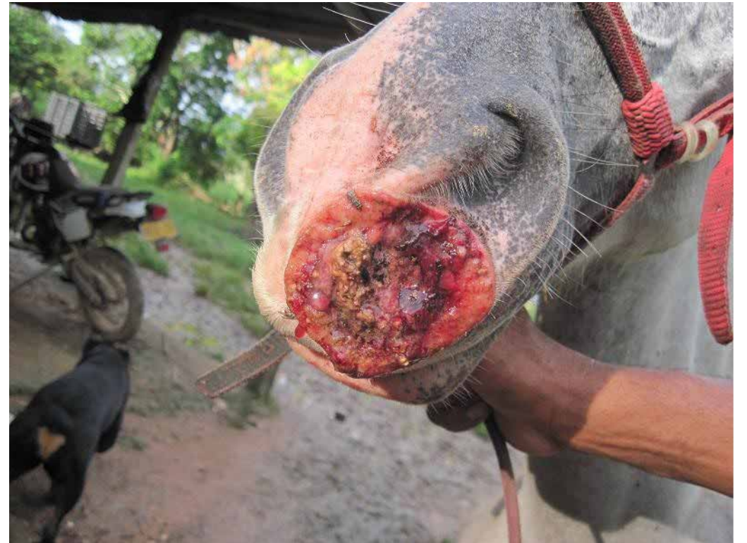
Fotos No. 1 y 2. Lesión en la nariz y labio superior de Pirata el 11 de noviembre de 2010.

En noviembre de 2010 se realizaron frotis, raspado, antibiograma y biopsia, exámenes con el laboratorio LMV (Laboratorio médico veterinario) en la ciudad de Bogotá. El tratamiento alopático que se aplicó en consecuencia consistió en limpiar con agua oxigenada, aplicar Amoxicilina inyectada (15 mg/kg por 5 días) 35 cc intramusculares de Calibiótico® por 5 días, acompañada de Cefalexina local de uso intramamario Rilexine® y Cutamycon® en spray sobre la herida. Este tratamiento detuvo el crecimiento de la lesión; sin embargo, ésta desapareció de un lado y migró al costado opuesto de la nariz, como se observa en las fotos No. 3 y 4.