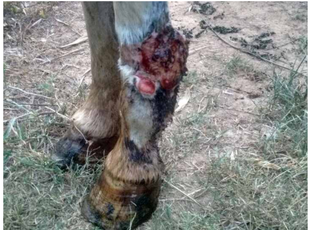
Fotos No. 10 y 11. Recaída de la lesión de Pirata el 27 de mayo de 2016.

Entonces Pirata fue repertorizado nuevamente (ver cuadro No. 4) y se comenzó un tratamiento con 1 gota de Nitric Acid 200® diluida en 10 cc de agua, con 10 golpecitos previos, todos los días en la mañana desde junio hasta diciembre del 2016. En julio la lesión se veía como en las fotos No. 12, 13 y 14; en septiembre se veía como en la foto No. 15, en octubre y noviembre estaba como se ve respectivamente en las fotos No. 16 a 21, la herida presentaba un aspecto sanguinolento y pruriginoso, pero estaba comparativamente mejor que en otros momentos, sin embargo el caballo lucía triste y el ganglio pectoral izquierdo seguía inflamado.