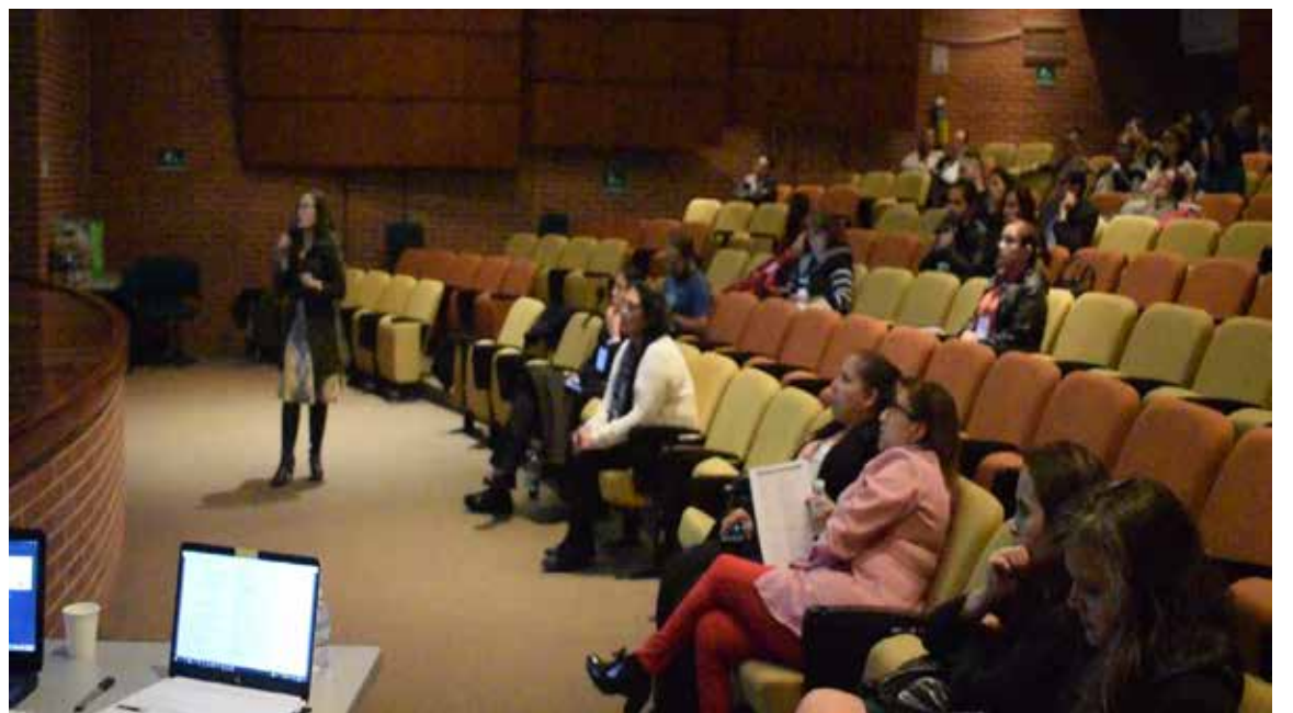
Tercer Simposio Enfermedades Huérfanas 2019.

La calidad e importancia de las conferencias presentadas y de los foros desarrollados fue reconocida y destacada por los miembros de la IAVH en su reunión anual, dado que se desarrollaron importantísimos tópicos que marcan una proyección muy importante de la Homeopatía en el desarrollo de la industria agrícola mundial y el tratamiento de animales y del medio ambiente.