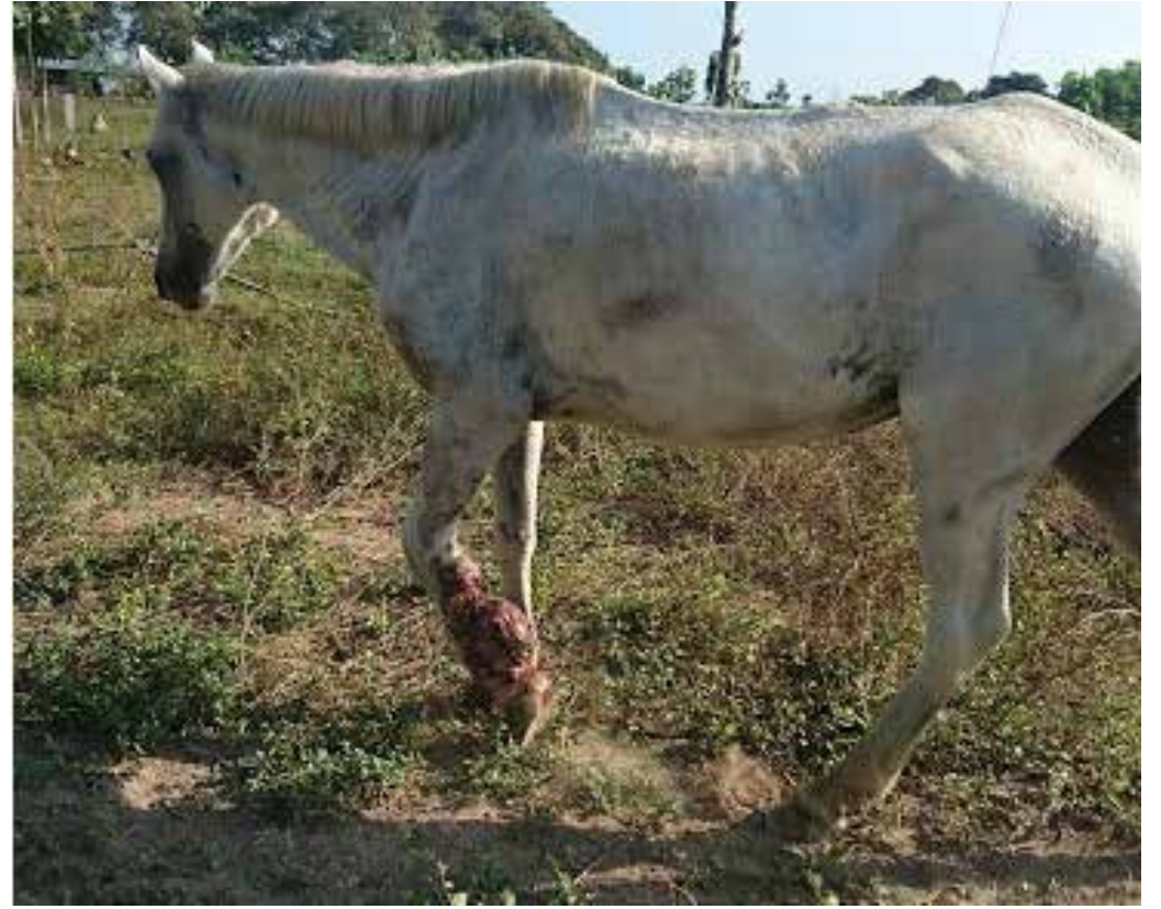
Fotos No. 22 y 23. Pirata con su lesión en el momento en que se decide enviar a sacrificio para evitar el encarnizamiento terapéutico, enero de 2017.