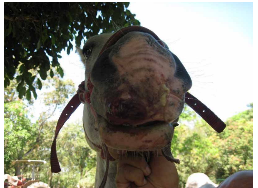
Fotos No. 3 y 4. Lesión en el lado opuesto de la nariz y labio superior de Pirata el 8 de febrero de 2011.

Al ver que no se encontraba la causa de las lesiones y que éstas empeoran, en febrero del 2011 el caso fue evaluado bajo la doctrina homeopática, se realizaron los procedimientos médicos, la repertorización del caballo indicó un tratamiento con Mercurius Vivus 200 CH, incrementando de 1 hasta 10 gotas y luego de 10 a 1 diluidas en 10 cm de agua, siempre dando 10 golpes al frasco contra la palma de la mano, por medio de los cuáles se potencia la sustancia curativa. Una semana después de darle el medicamento, el caballo estaba más sano.